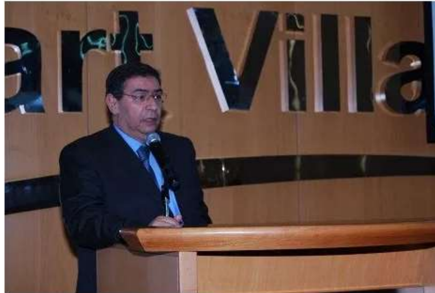
“فيزا” وشعبة الاقتصاد الرقمي تتبنى الابتكار في مجال المدفوعات بمصر